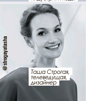
Таша Стрोगова, телеведущая, дизайнер

😊 — Умница-красавица. Отличное решение для публичного выхода. Лаконичный силуэт и длина платья визуально стройнят, туфли с тонкими ремешками и яркой отделкой подчеркивают красоту ног. А вот принт на платье меня смутил. Сочетание мелкого и очень крупного рисунка может быть интересно, но в данном случае выглядит необоснованным.