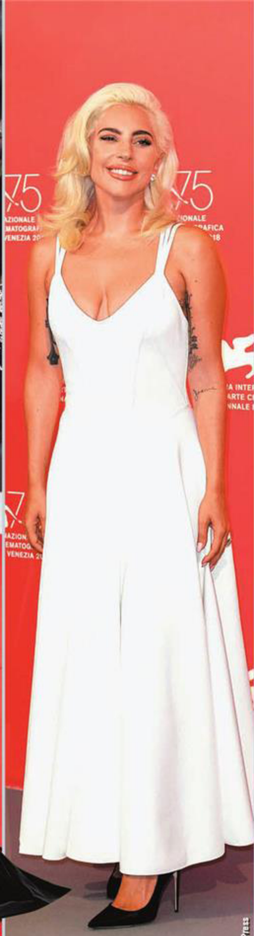
Певица Леди Гага 75-й Венецианский кинофестиваль