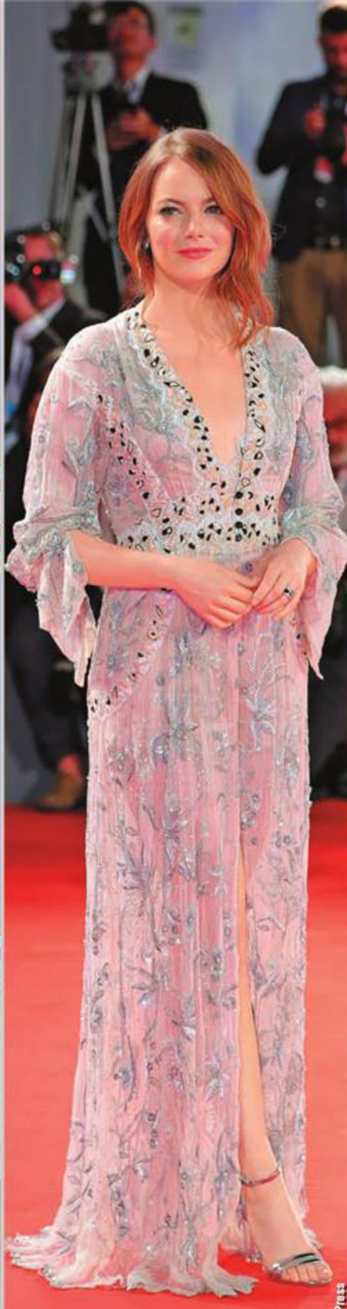
Актриса Эмма Стоун 75-й Венецианский кинофестиваль