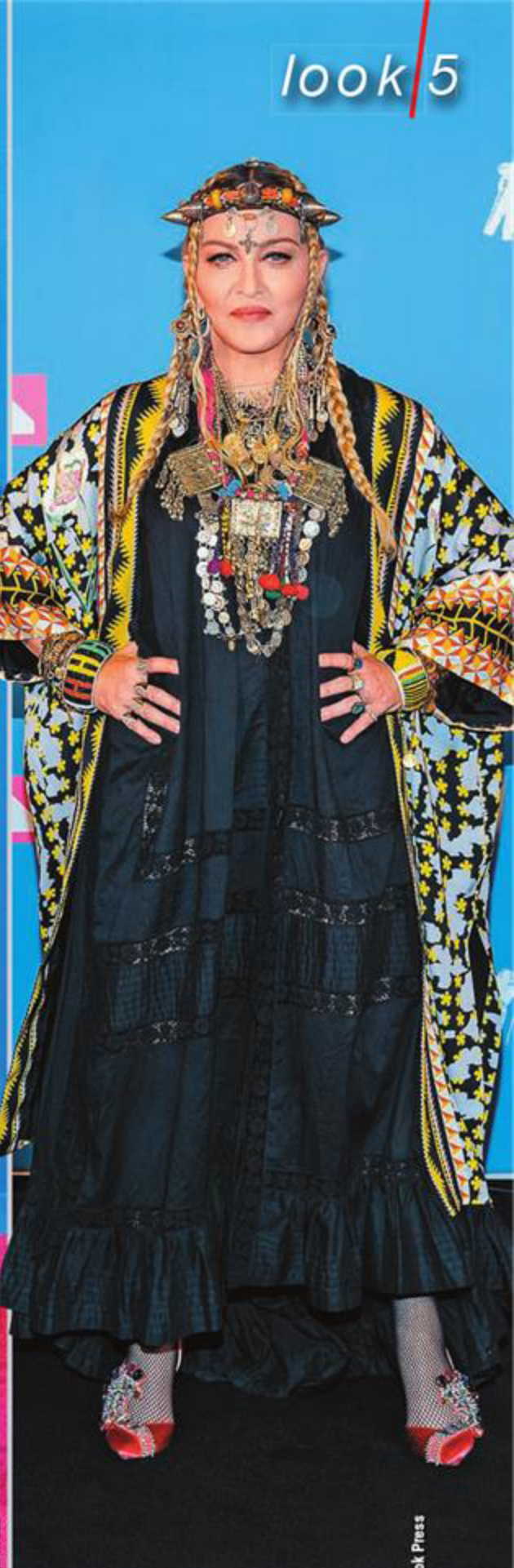
Певица Мадонна MTV Video Music Awards

😊 — Неординарное решение для красной дорожки. Отсутствие «нарядности» освежает образ. Удлиненный жакет с узкими укороченными брючками подчеркивает стройную фигуру актрисы. Синий принт напоминает то ли голландские изразцы, то ли мотивы русской Гжели, и благодаря цветовому немногословию задает образу ноты легкомысленной юности.