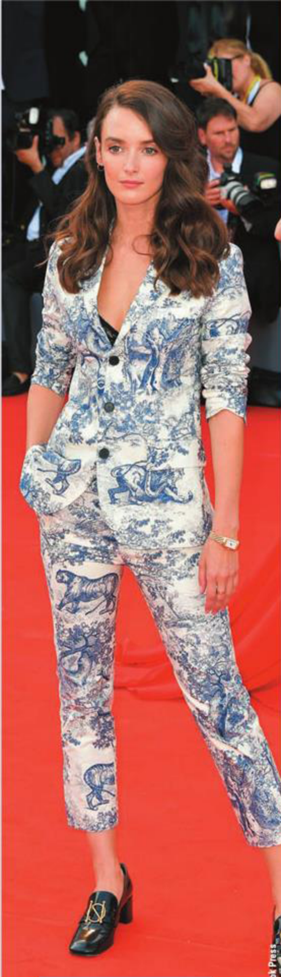
Актриса Шарлотта Ле Бон 75-й Венецианский кинофестиваль