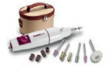
Набор для маникюра и педикюра Laica SA5440 код 550048