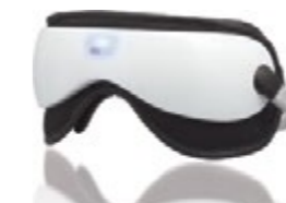
Массажер для глаз роликовый iSee-360 код 542412