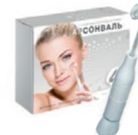
Дерматон с 4мя насадками Biolift4 BT201S код 542411