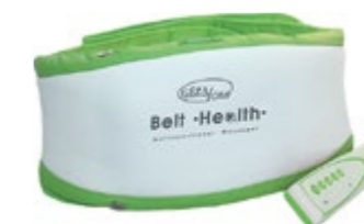
Многофункциональный прибор «Пояс Здоровья» M142 код 542416