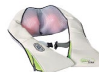
Массажер для тела роликовый IRelax AMG395 код 542415