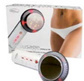
Ультразвуковой массажер для тела M380 код 542417