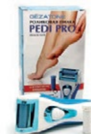
Роликовая пилка для ног PediPro 126D код 550047