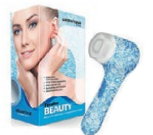
Щетка для чистки лица Tender Beauty AMG106SA код 542430