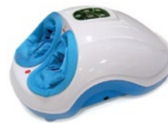
Массажер для ног SkyStep AMG718 код 550045