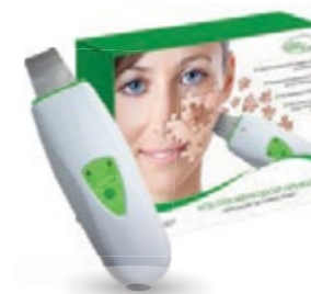
Аппарат для ультразвуковой чистки лица HS23071 код 542853