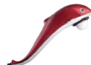
Массажер для тела «Дельфин» AMG6093 код 550046