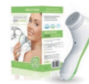
Массажер-щетка для лица Biosonic AMG195 код 550044