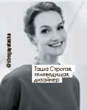
Таша Строгая, телеведущая, дизайнер

☹️ — Модный образ разрушен. Укороченные широкие штаны в сочетании с футболкой в полосу визуально укоротили ноги и удлиннили верхнюю часть туловища.