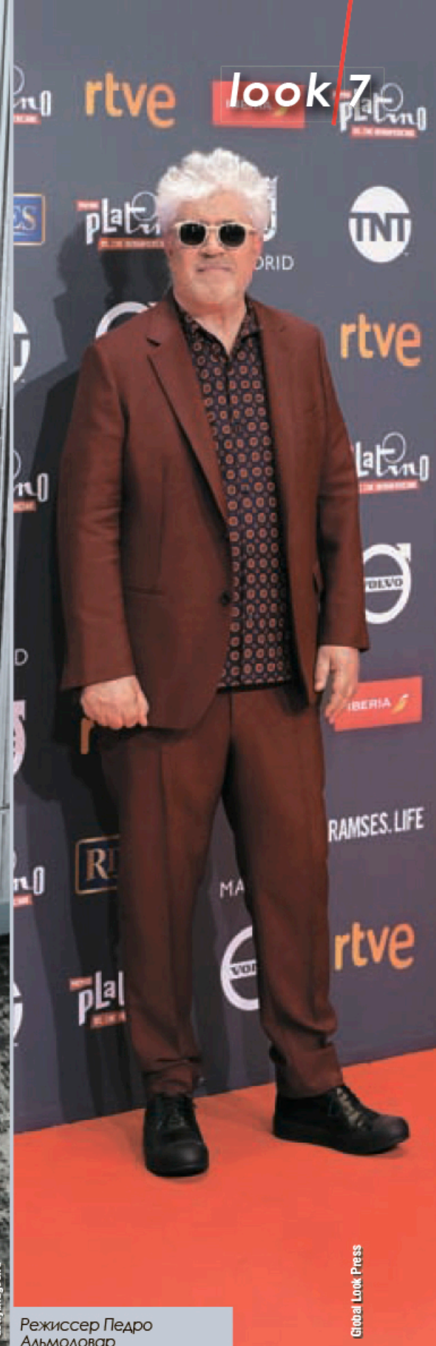
Режиссёр Педро Альмодовар

☹️ — Красавец швед не может не привлечь внимание. Рост и телосложение позволяют ему с лёгкостью следовать самым актуальным трендам. Но не в данном случае. Выбранный образ выглядит плоско и скучно. Корректный оттенок серого, белая сорочка и черные туфли. Просто сотрудник финансовой компании в обеденный перерыв.