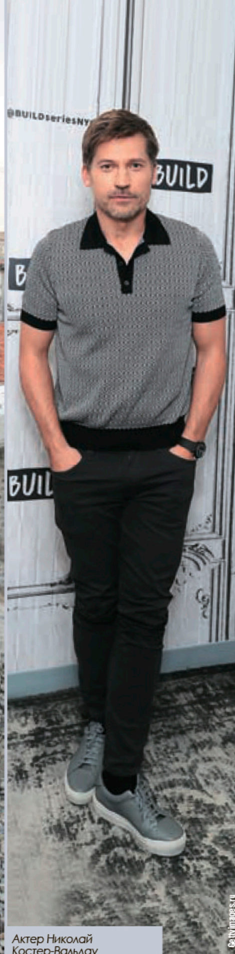
Актёр Николай Костер-Вальдау