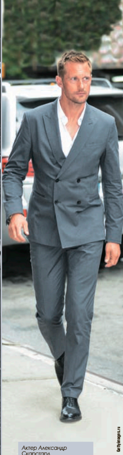
Актёр Александр Скарсгард