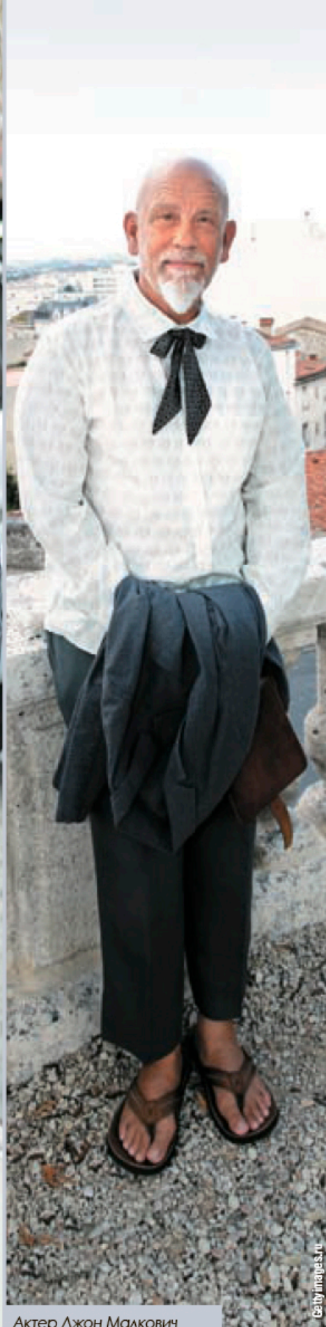
Актёр Джон Малкович