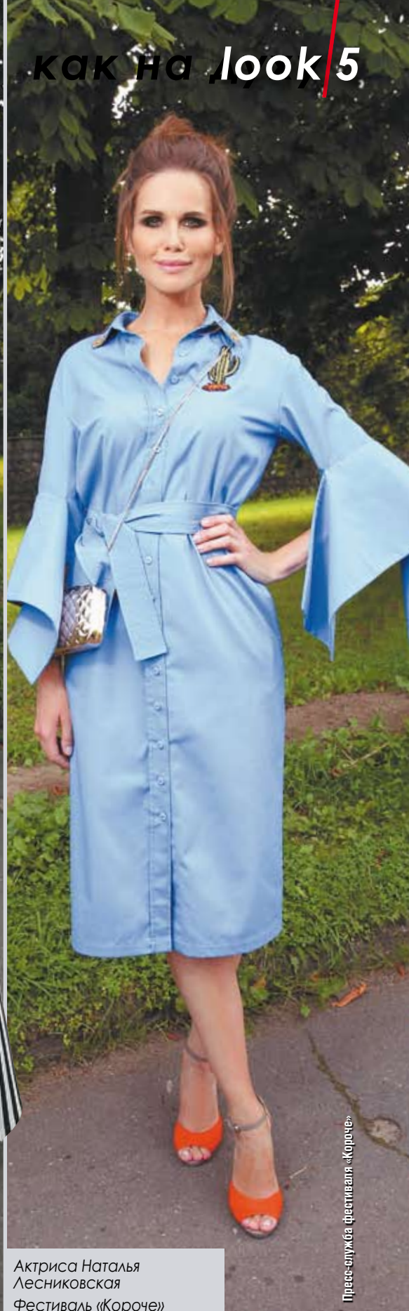
Актриса Наталья Лесниковская Фестиваль «Короче»