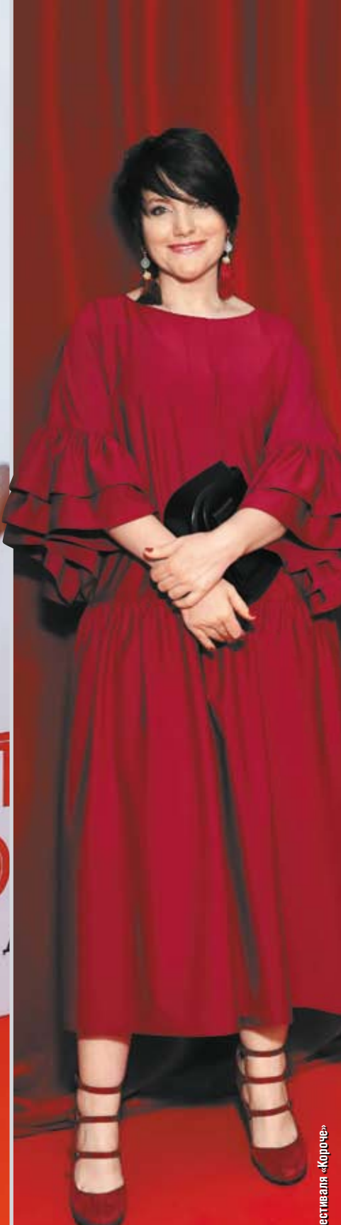
Актриса Инга Оболдина Фестиваль «Короче»