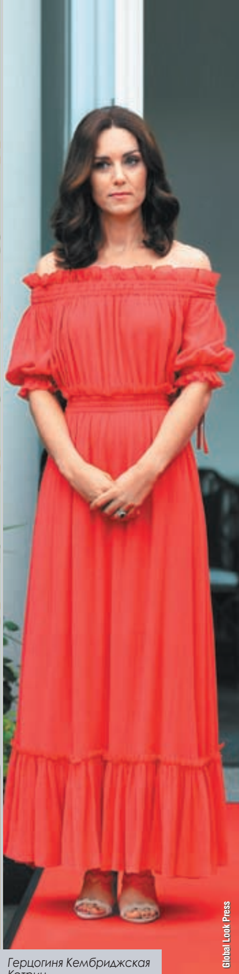
Герцогиня Кембриджская Кэтрин